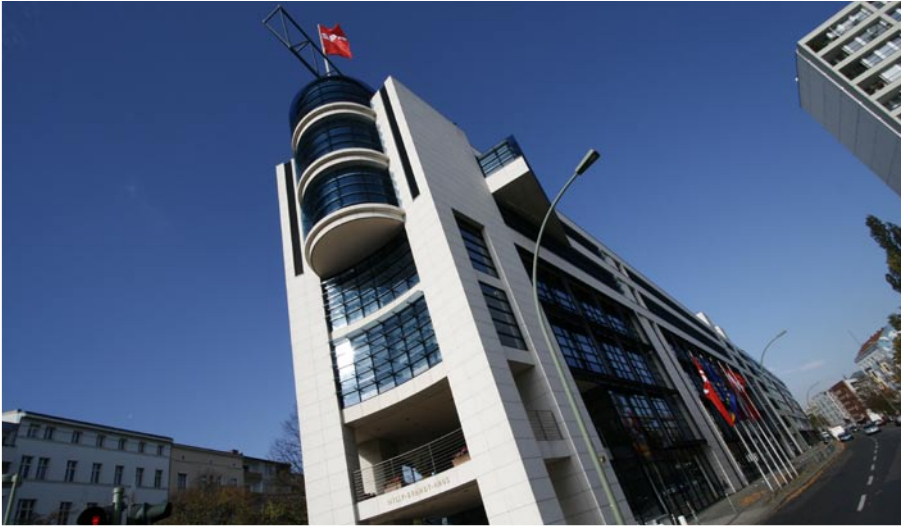
Das Willy-Brandt-Haus in Berlin