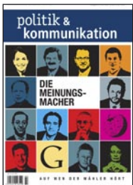
Die neue p&k-Ausgabe