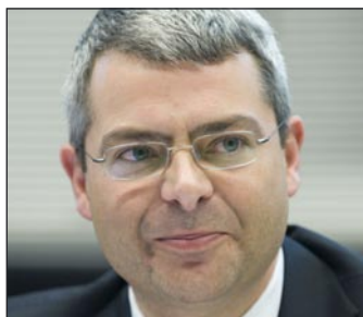
Hans Martin Bury

Rainer Wend (54), der langjährige wirtschaftspolitische Sprecher der SPD-Bundestagsfraktion, wird Chef-Lobbyist bei der Deutschen Post . Am 1. April 2009 wird er sein Amt als Leiter des Zentralbereichs Politik und Nachhaltigkeit bei dem Logistik-Konzern antreten. Wend folgt auf seine Parteikollegin Monika Wulf-Mathies, der früheren EU-Kommissarin und Ex-Vorsitzenden der Gewerkschaft ÖTV, die Ende 2008 mit 66 Jahren in den Ruhestand geht (politikszenen Nr. 211 berichtete). Der SPD-Politiker Wend hatte schon vor einigen Monaten angekündigt, dass er nicht mehr neu für den Bundestag kandidieren werde. Der promovierte Jurist habe bewusst eine neue Tätigkeit in der Wirtschaft gesucht.